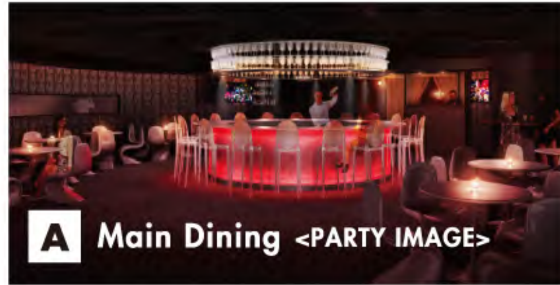
A Main Dining <PARTY IMAGE>