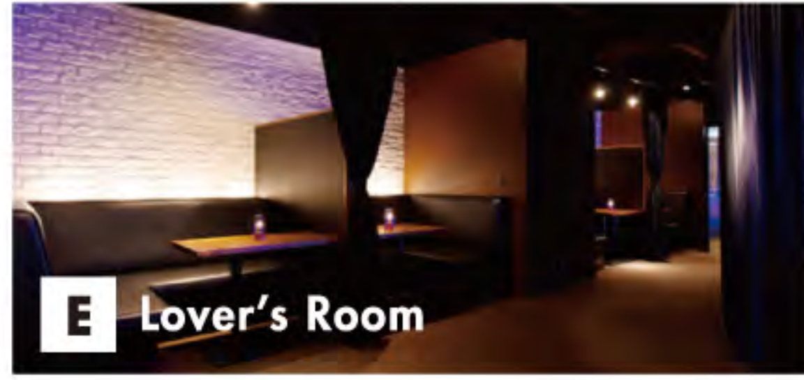
E Lover's Room