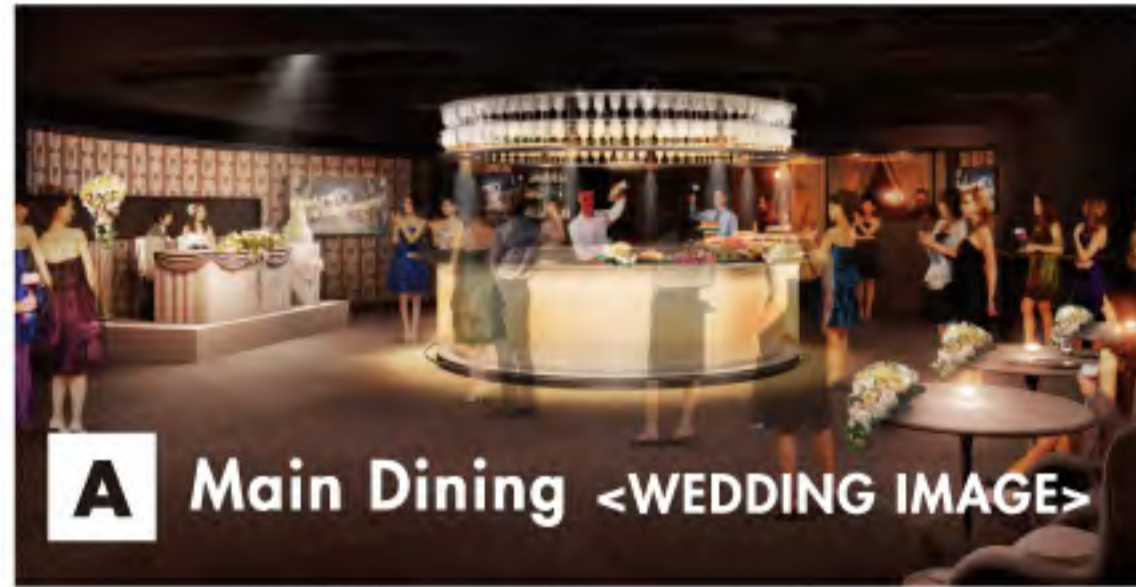
A Main Dining <WEDDING IMAGE>