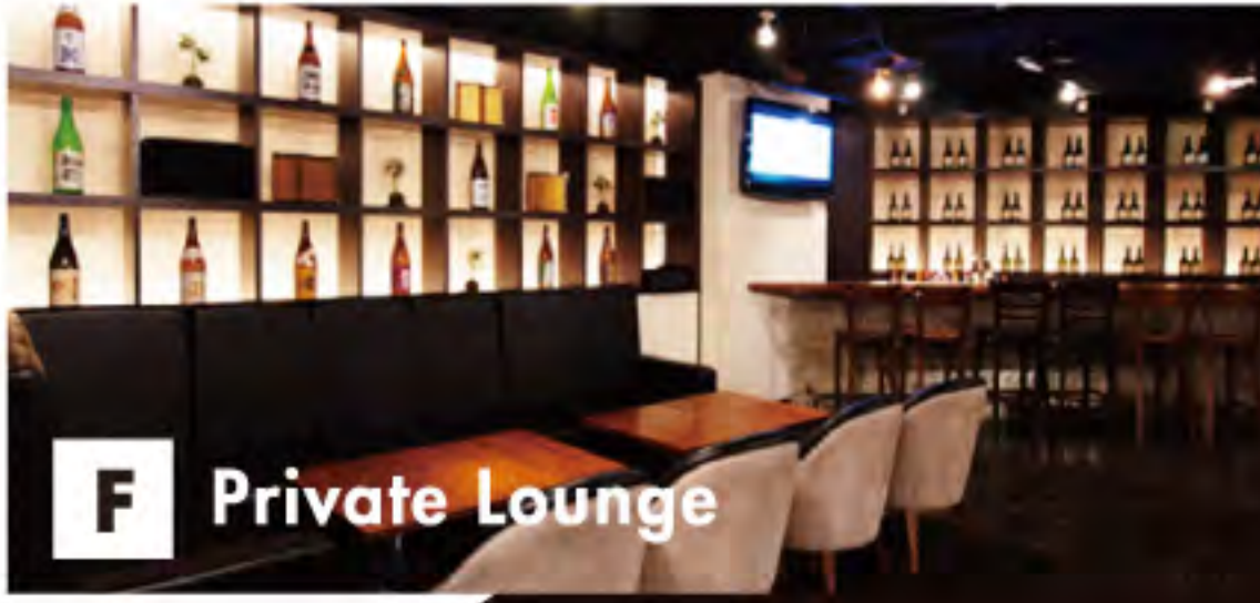
F Private Lounge