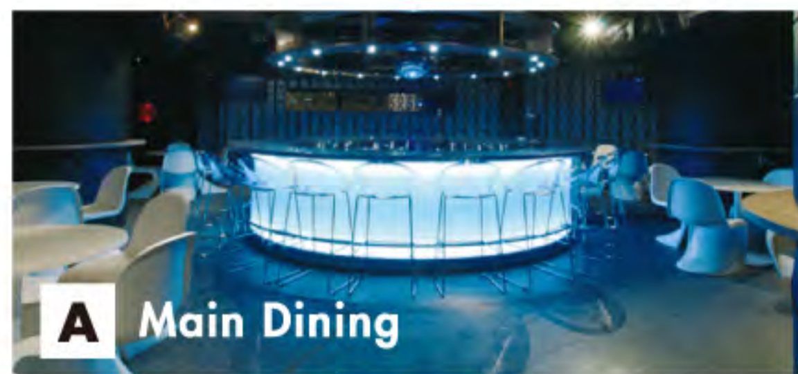
A Main Dining